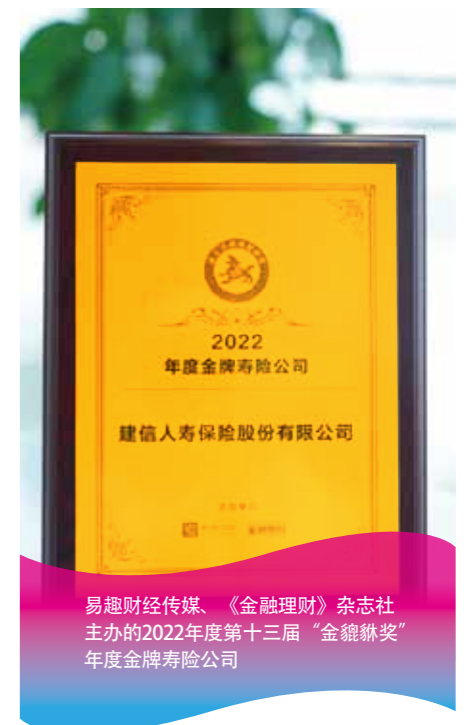
易趣财经传媒、《金融理财》杂志社 主办的2022年度第十三届“金貔貅奖” 年度金牌寿险公司