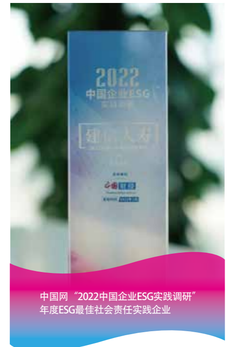
中国网“2022中国企业ESG实践调研” 年度ESG最佳社会责任实践企业