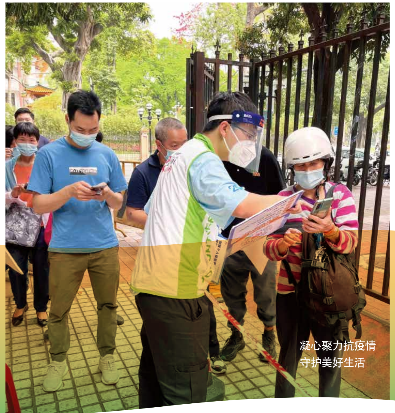
凝心聚力抗疫情 守护美好生活

公司党委号召各党支部、党员在做好疫情防控，保障业务发展和客户服务不松懈的同时，践行初心使命，带头投身防疫一线志愿工作。各地员工作为志愿者参与到社区防疫一线，协助社区工作人员、医护人员检测核酸，为居民分发物资、运送快递，解决人民群众“急难愁盼”问题，总服务时长超过2000小时。