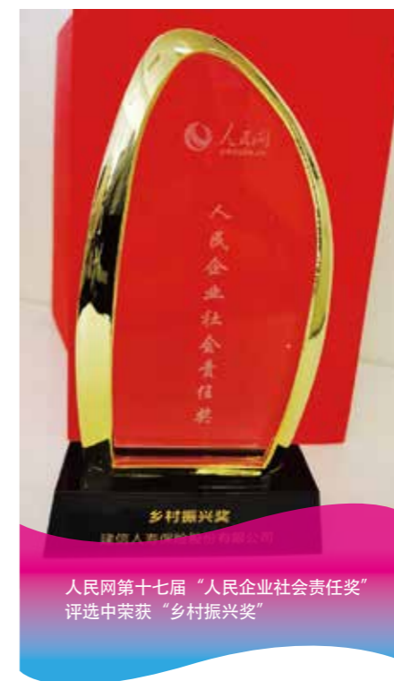
人民网第十七届“人民企业社会责任奖” 评选中荣获“乡村振兴奖”